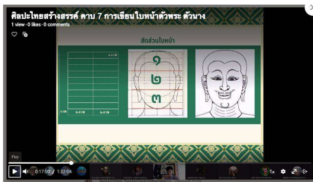
สื่อเนื้อหา Powerpoint

ภาพและสื่อการสอน : อาจารย์กิตติศักดิ์ คนแรงดี