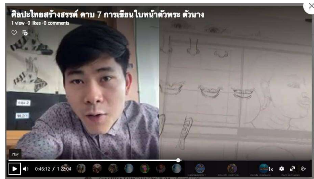
ผู้สอนขณะสอนออนไลน์