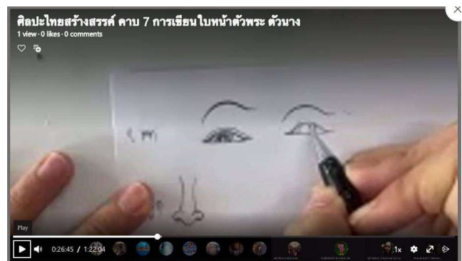
สื่อสาธิต วิดีทัศน์สาธิตการวาด